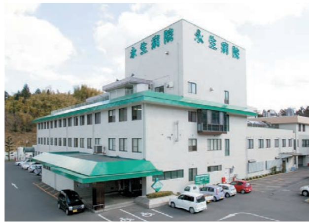
永生病院 130床(一般病棟 40床・介護医療院 90床)

永生病院広報誌「ゆるめき」第62号 発行元：医療法人 圭良会 永生病院 編集者：医療サービス改善委員会 住所：〒769-0311 仲多度郡まんのう町買田221-3 TEL:0877-73-3300 FAX:0877-73-3202 永生病院のホームページ http://www.eisei-hp.or.jp/ eメールでのお問い合わせは keiryokai@eisei-hp.or.jp 発行年月日:令和3年1月15日